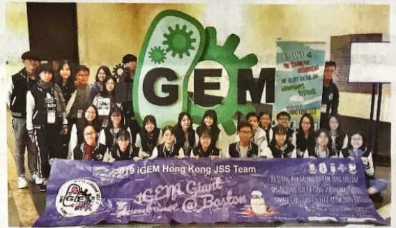
■ Hong Kong JSS 聯校隊伍於iGEM比賽場地合照。