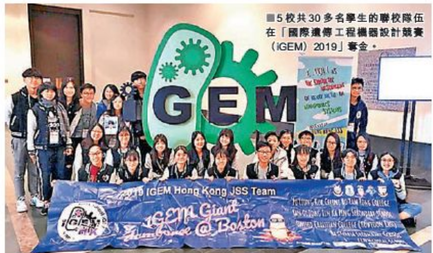
■5校共30多名學生的聯校隊伍在「國際遺傳工程機器設計競賽 (iGEM) 2019」奪金。

香港年輕一代具備驚人的科研潛能，以創意研究項目揚威國際。由本港5所中學學生組成的聯校隊伍「Hong Kong JSS」，透過研究對大腸桿菌進行基因改造，增加其吸收重金屬的能力並首創出低成本的細菌過濾器「B-CAD」，本月成功於全球最大的合成生物學國際比賽「國際遺傳工程機器設計競賽 (iGEM) 2019」奪得金獎殊榮，更是iGEM歷史中首次有香港中學隊伍奪金，為港爭光。