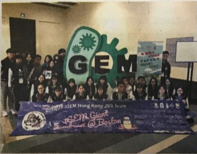
■ Hong Kong JSS聯校隊伍準備比賽。

香港於2016年首次有中學隊伍參加iGEM比賽。今年，由仁愛堂田家炳中學、滙基書院(東九龍)、五旬節中學、保良局何蔭棠中學及德蘭中學組成的Hong Kong JSS聯校隊伍，於比賽中奪得金獎殊榮，成為iGEM歷史中首次有香港中學隊伍奪金，證明香港中學生的能力可以達到全球最頂尖的水平。