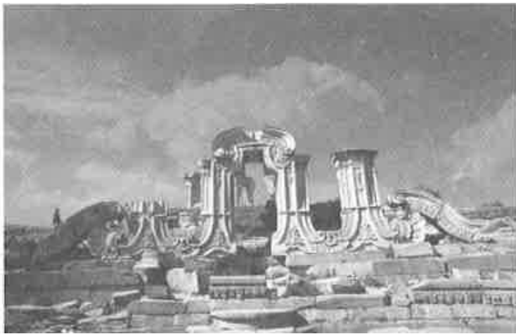
經英法聯軍破壞的圓明園